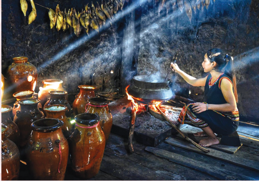
Bếp lửa ngày xuân.