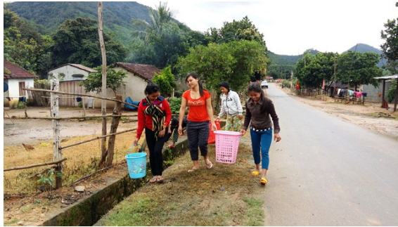
Chị em phụ nữ thôn Kon Đó - xã Đăk Kôi thu gom rác tại đường liên thôn

Hưởng ứng phong trào “Chống rác thải nhựa, nilon” của trung ương và tỉnh Kon Tum, Hội Liên hiệp phụ nữ huyện Kon Rẫy đã xây dựng nhiều mô hình thiết thực, hiệu quả bảo vệ môi trường bắt đầu từ việc nhỏ nhất là giữ gìn vệ sinh trong gia đình rồi mới đến đường làng, ngõ xóm.